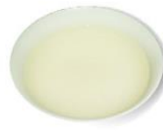
粥湯/肉湯/魚湯/菜湯