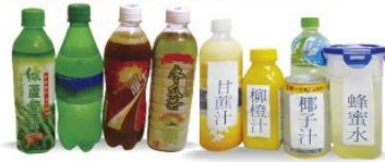
無渣飲料/無渣果汁