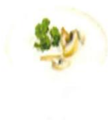
粥湯/肉湯/魚湯/菜湯