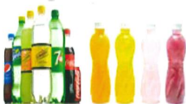
無渣飲料/無渣果汁