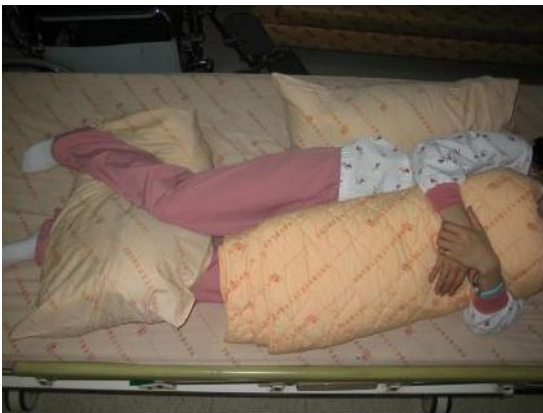
側躺在健側 Berbaringlah di kontralateral