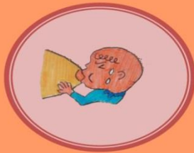
哺乳姿勢錯誤 或含乳不正確