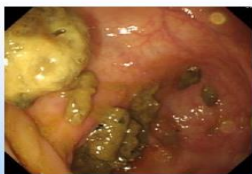
解出混濁液態糞便