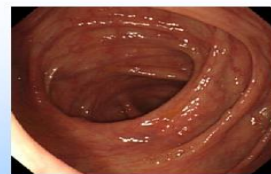
解出黃色清澈液體