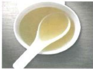
無渣湯汁(葷素皆可)