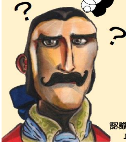
認識自體高濃度血小板血漿(PRP)