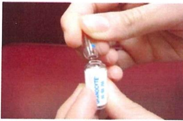
(圖三、折斷 1 瓶為 1 C.C 之無菌蒸餾水)