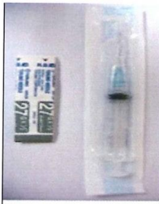
(圖一、3 C.C 無菌空針)

使用 3 C.C 無菌空針(圖一)，抽取 1 C.C 無菌蒸餾水注入 1 瓶 250ug 之 G-CSF(圖二)，輕搖均勻調製之藥液後抽取，準備皮下注射(常見選擇注射部位為：手臂、腹部、大腿、臀部之皮膚)。備註：若採用 1 瓶 300ug 之 G-CSF 不加無菌蒸餾水 ，可直接抽取藥液注射。