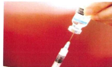
(圖六、空針抽取調製之藥劑)