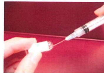
(圖四、採用無菌空針，抽取 1 C.C 無菌蒸餾水)