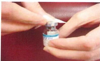
(圖五、採用酒精棉片擦拭，250ug 白血球生長激素之橡皮套膜)