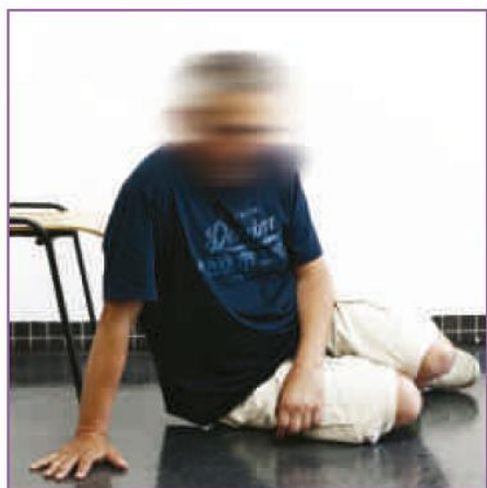
❶ 坐在地上，好手支撐地面