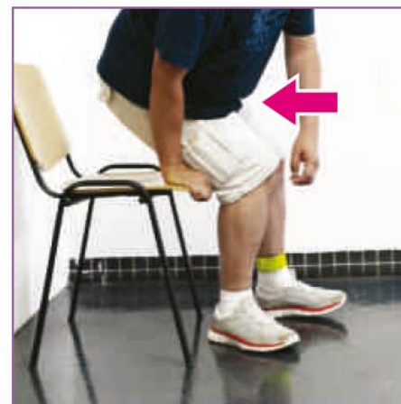
❻ 將臀部轉向椅面，然後慢慢坐下。