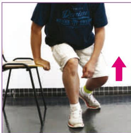
❺ 身體往前彎，用好手及好腳支撐站起。