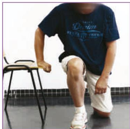
❹ 用好手扶椅面，將好腳往前抬高，踩在地面