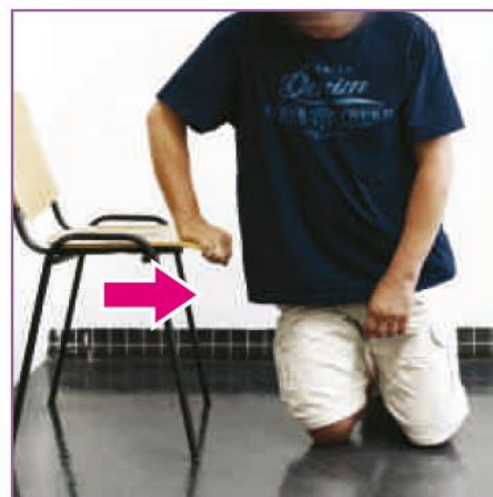
❸ 好手扶椅面，將身體挺直，成跪姿。