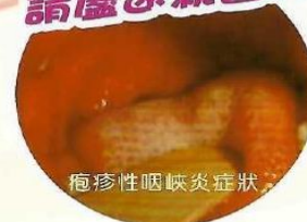
疱疹性咽峽炎症狀