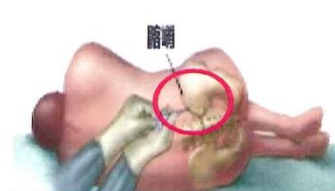
(圖三、抽取髂骨間液)