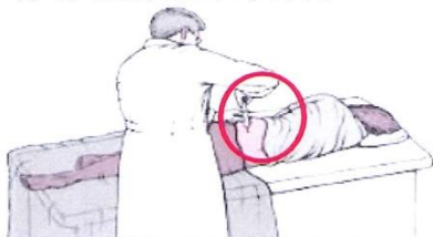
(圖一、臥躺姿勢鋪上無菌洞巾)

病人採用臥躺姿勢鋪上無菌洞巾(圖一)，藉由醫療器具骨髓穿刺針(圖二)抽取髂骨間液(圖三)之骨脊髓液約 0.5 C.C~1 C.C，藉由送檢骨脊髓液或製成骨脊髓液組織切片。